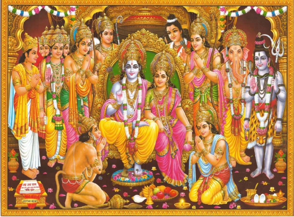
This is a rare portrait of SHIRAMA PATTABHISHEKAM. Wishing this should reach as many people as possible before SHIRAMA NAVAMI . Pl join us in this HANUMAN MISSION and get the blessings of HANUMAN. -K.Balaji/2002

వామే భూమి సుతా పురశ్చ హనుమాన్ పశ్చాత్ సుమిత్రా సుతః శత్రుఘ్నో భరతశ్చ పార్శ్వ దళయోః వాయాది కోణేషుచ సుగ్రీవశ్చ విభీషణశ్చ యువరాట్ తారాసుతో జామ్భవాన్ మధ్యే నీల సరోజ కోమలరుచిం రామం భజే శ్యామలం